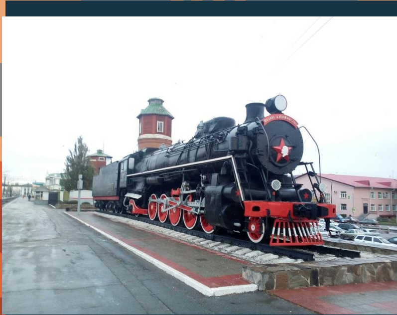
Паровоз «Феликс Дзержинский» (привокзальная площадь, г. Курган)

В 1941–1945 гг. пространство военных перевозок заняло одну шестую часть суши. Важно отметить, что железнодорожники оказались профессионально готовыми к испытанию: до войны была проведена техническая модернизация транспорта, в частности внедрены мощные паровозы ФД – «Феликс Дзержинский», новые автосцепки и автоблокировки большегрузных вагонов и многое другое. Подвижной состав благодаря отработанной технологии перевозок и профессиональным навыкам труда мог осуществлять необходимые во время войны сверхперевозки.